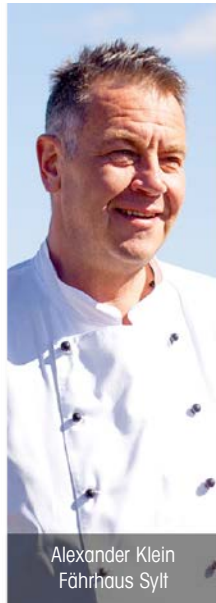
Alexander Klein Fährhaus Sylt