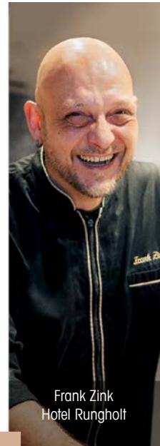
Frank Zink Hotel Rungholt

EINE EXKLUSIVE GOURMETREISE DURCH DIE KÜCHEN DER PRIVATHOTELS SYLT