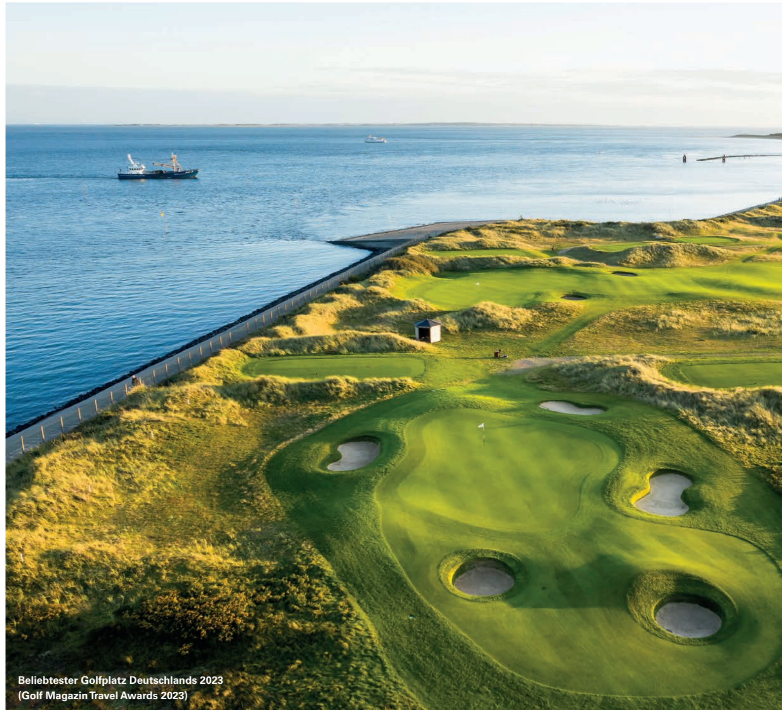
Beliebtester Golfplatz Deutschlands 2023 (Golf Magazin Travel Awards 2023)